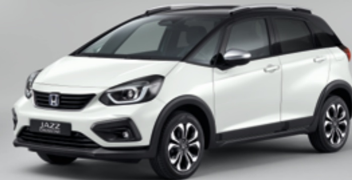
PLATINUM WHITE PEARL / TWO-TONE