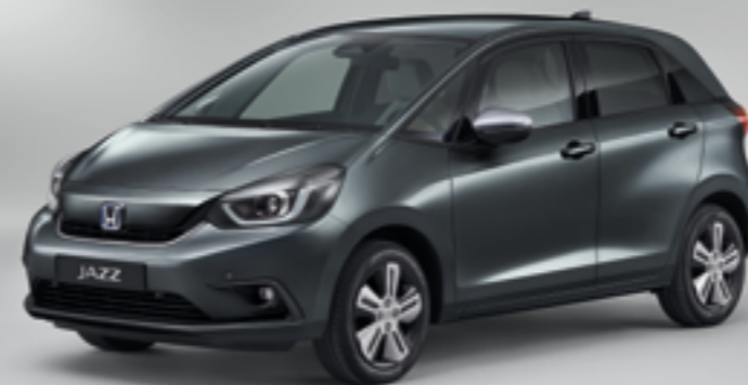
SHINING GRAY METALLIC