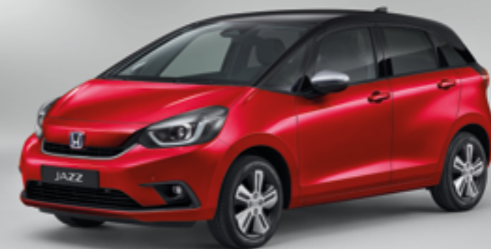
PREMIUM CRYSTAL RED METALLIC / KAHEVÄRVILINE