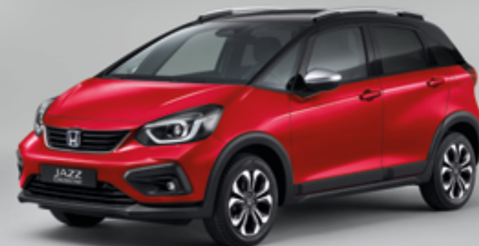
PREMIUM CRYSTAL RED METALLIC / KAHEVÄRILINE

Näidatud mudel on Jazz Crosstar 1.5 i-MMD. Toon Surf Blue ja näidatud kahevärvilised värvivalikud on saadaval ainult Jazz Crosstarile.