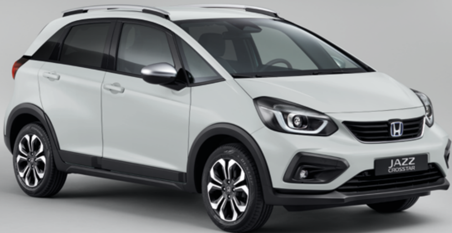
TAFFETA WHITE III

Uus Jazz Crosstar on saadaval pilkupüüdvates kahe- ja ühevärvilistes kujundustes, mille seas on ka eksklusiivne toon Surf Blue. Istmed on kaetud mugava ja vastupidava veekindla tekstiiliga, mis aitab salongi puhta ja elegantsena hoida, ükskõik kuhu lähed.