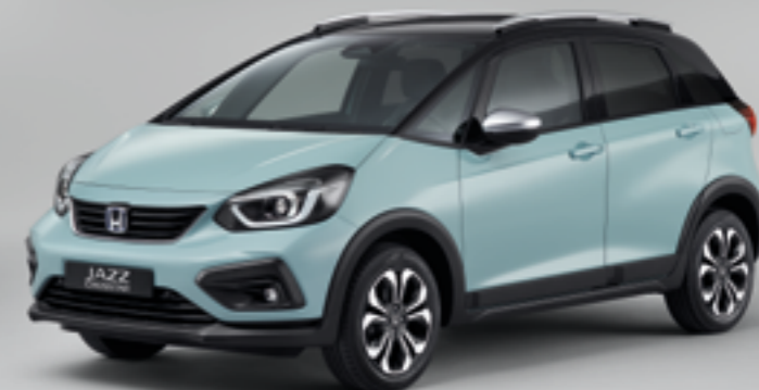
SURF BLUE / TWO-TONE