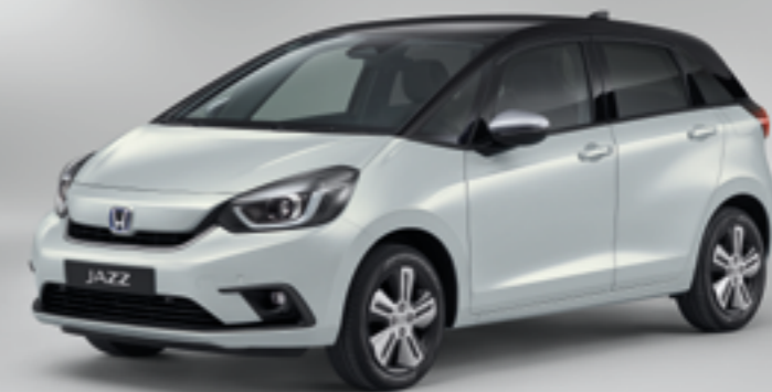
PREMIUM SUNLIGHT WHITE PEARL / KAHEVÄRVILINE