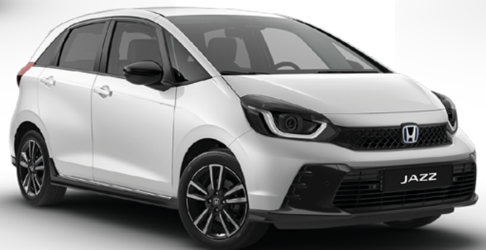
Platinum White Pearl