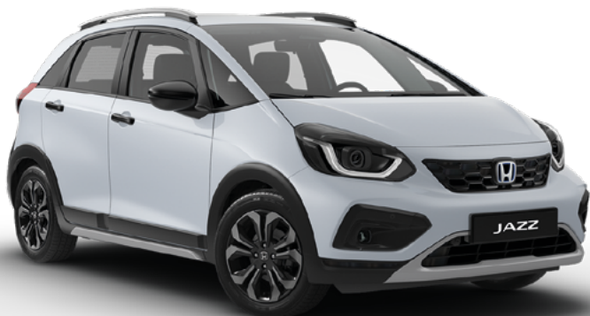
Premium Sunlight White Pearl