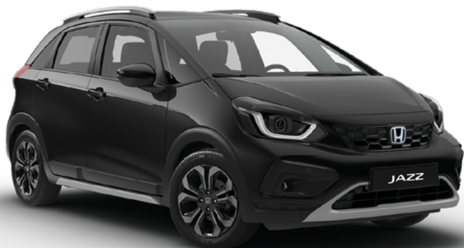
Crystal Black Pearl