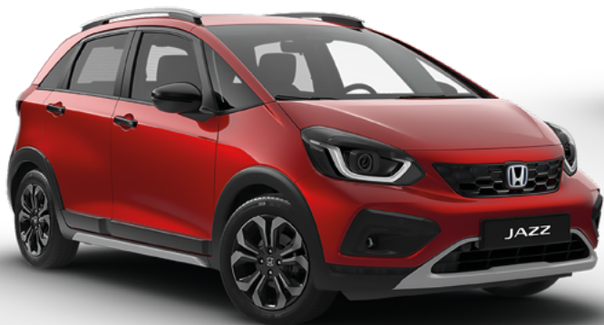
Premium Crystal Red Metallic