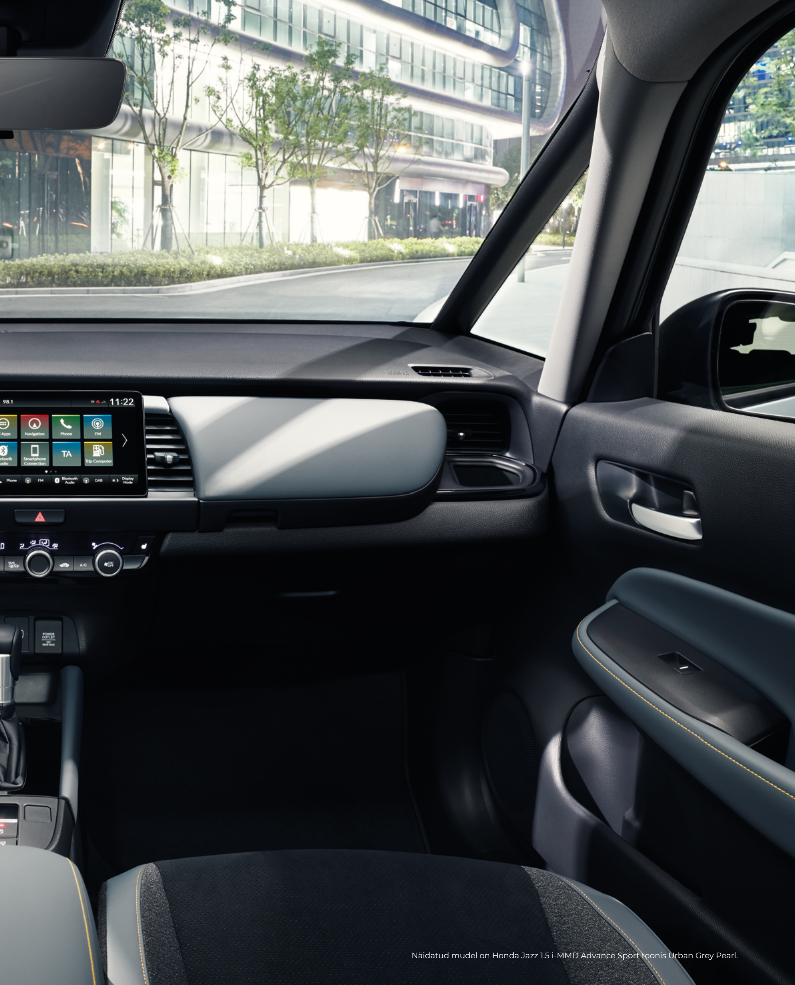
Näidatud mudel on Honda Jazz 1.5 i-MMD Advance Sport toonis Urban Grey Pearl.