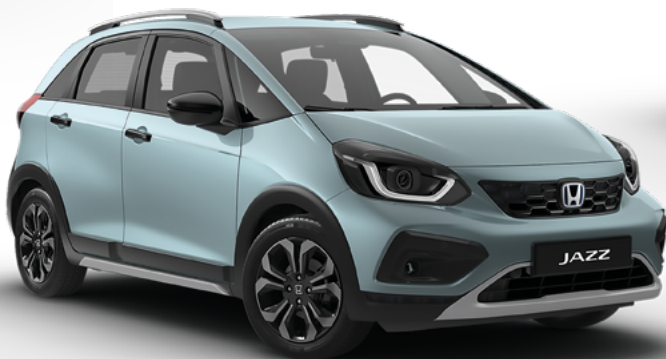
Fjord Mist Pearl