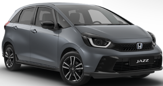
Urban Grey Pearl