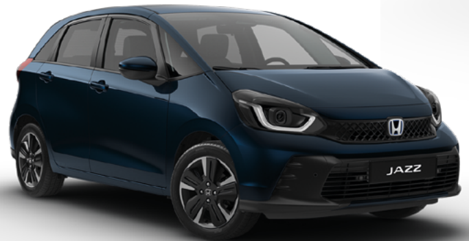
Midnight Blue Beam Metallic

Oleme loonud laia valiku värve, mis sobivad uuele stiilsele Jazzile ideaalselt ja mida täiendavad kvaliteetsed istmekatted.